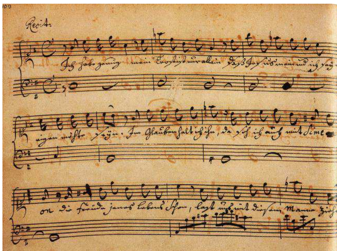
Cahier de notes d'Anna Magdalena