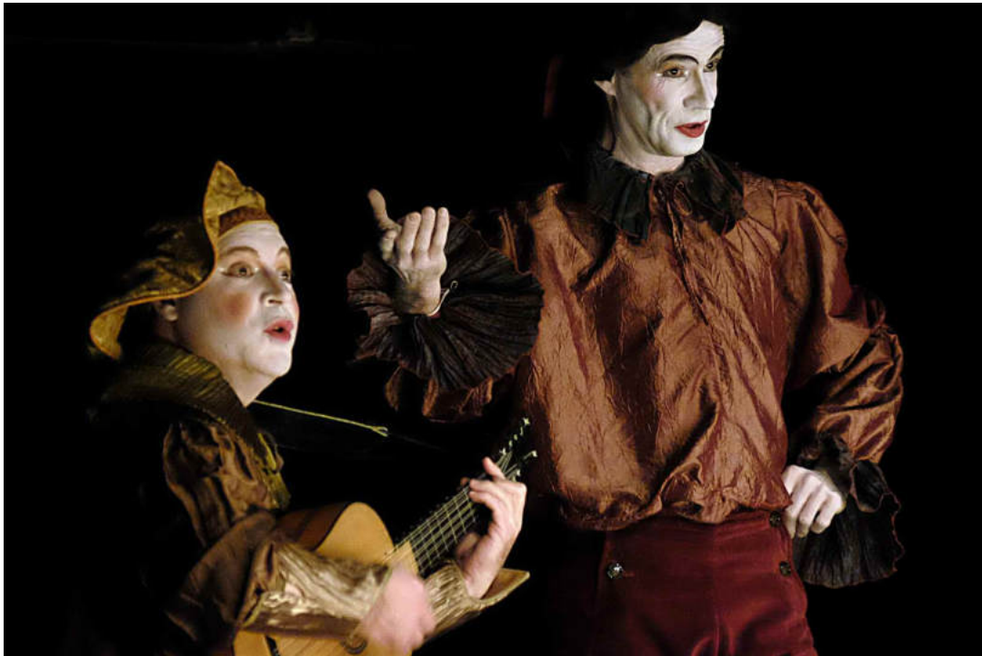
Les Fables au bout des doigts