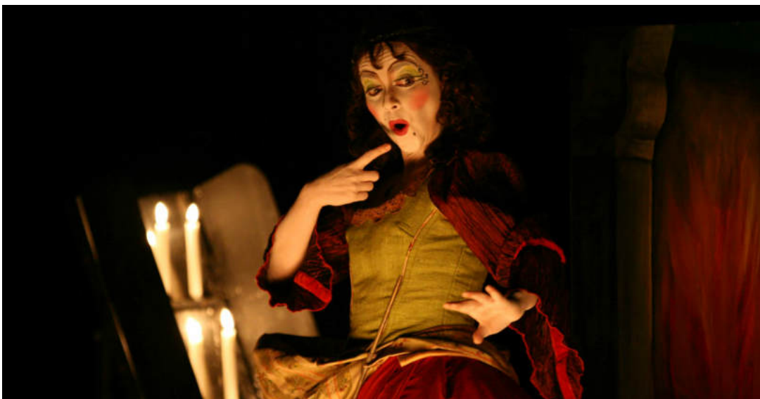
Perrault, Contes baroques