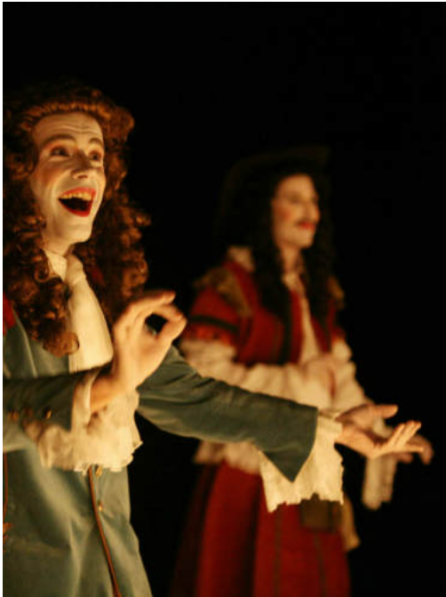
Les Fâcheux , Molière