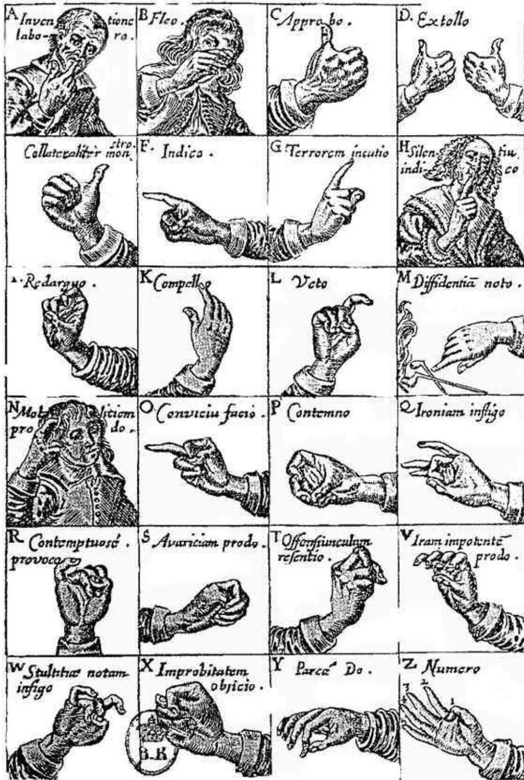
Planche de chirologie : gestes des doigts John Bulwer, 1ère édition 1644