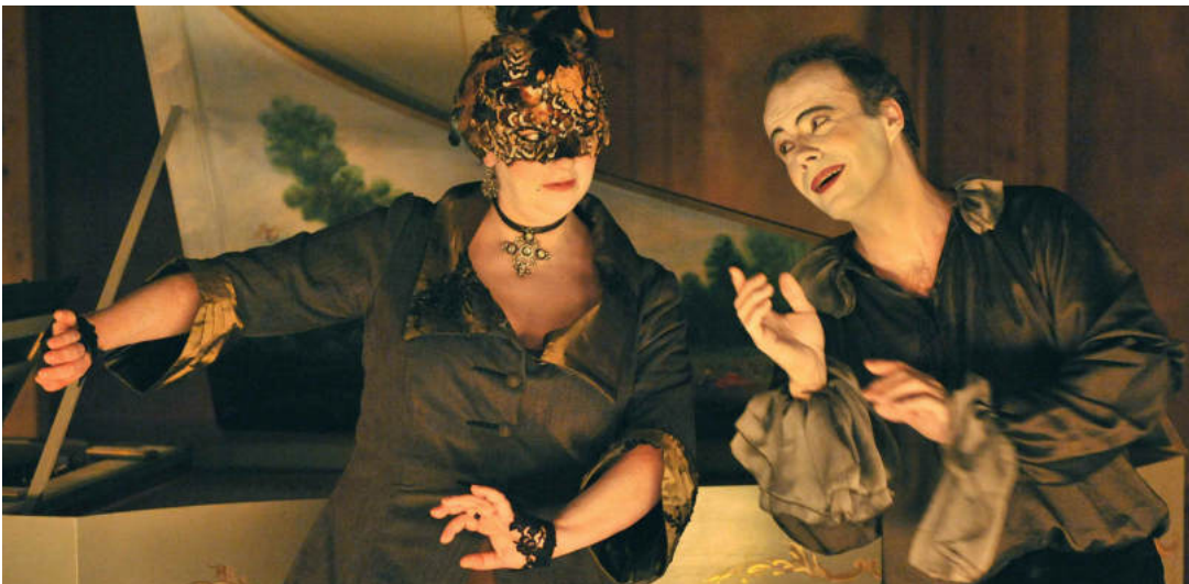
Les Folies françaises