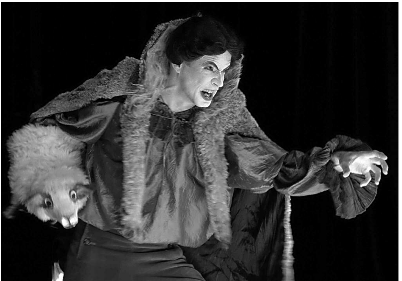
Le Loup et l'agneau , La Fontaine

Costumes Chantal Rousseau Perruques et maquillage Mathilde Benmoussa