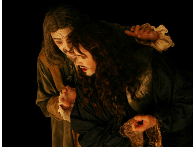
Andromaque , Racine